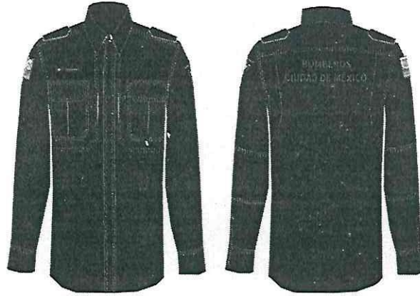
FIGURA 1: CONFECCIÓN DE LA CAMISOLA TÁCTICA (IMAGEN ILUSTRATIVA SOLAMENTE)

TODAS LAS COSTURAS SERÁN LIMPIAS, SIN TORCIDOS NI FRUNCIDOS, SE USARÁ PUNTADA DE SEGURIDAD DE TRES HILOS (TRIPLES) PARA UNIR LAS MANGAS CERRAR MANGAS Y CUERPO, UNIÓN DE PLAQUETA FRONTAL, CANESÚ TRASERO BOLSAS FRONTALES E INTERNAS, REFUERZOS EN CODOS Y EN AXILAS.