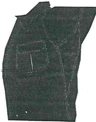
FIGURA 2: SUGERENCIA DE ELEMENTOS O INSERTOS PARA DISIPACIÓN DE SUDORACIÓN