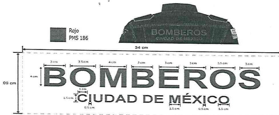
FIGURA 6: ESPECIFICACIONES MICROBORDADO EN ESPALDA.

EL MICROBORDADO NO SERÁ DIRECTO A LA PRENDA, SERÁ HECHO SOBRE EL PANEL RECTANGULAR COSIDO EN LA ZONA INDICADA. EL PANEL SERÁ COSTURADO EN SU PERÍMETRO. NO LLEVARÁ RIBETES NI BORDES EN SU CONTORNO.