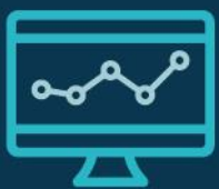
Tabla de índice de cumplimiento