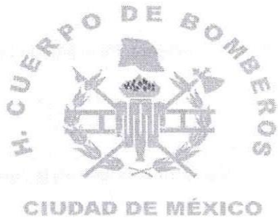
PUERTA IZQUIERDA (OPERADOR)

BOMBEROS" y leyenda horizontal baja "CIUDAD DE MÉXICO" color dorado Pantone PMS 117. Respetando la orientación con el casco y pértiga siempre al frente.