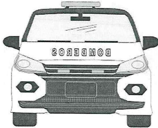
Figura 1 Vista Frontal

MITSU INTERLOMAS, S.A. DE C.V. CONTRATO No: HCBCDMX/032/2024