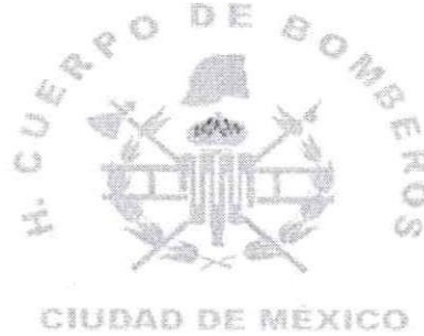
PUERTA DERECHA (PASAJERO)

Puertas traseras: Leyendas en dos líneas: Superior BOMBEROS inferior "CIUDAD DE MÉXICO" en blanco reflejante con un contorno en negro de 5mm, fuente "arial black" en la cajuela de forma repartida de acuerdo al espacio.