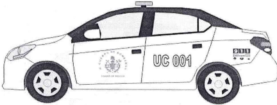
Figura 3 Vista lateral