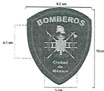
Figura 2: Especificaciones para escudo manga izquierda