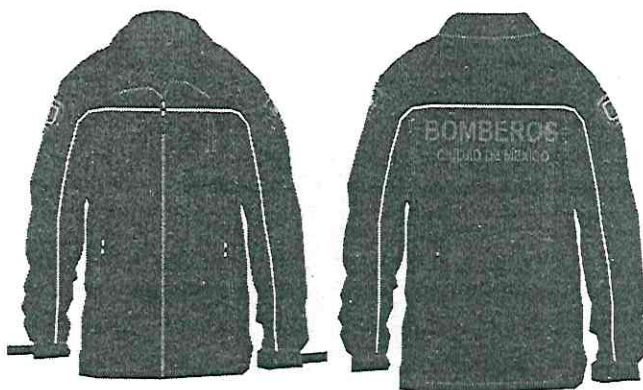
Figura 1: Confección de la chamarra táctica.

Todas las costuras deberán ser limpias, sin torcidos ni fruncidos, se usará puntada de seguridad de tres hilos (triples) para unir las mangas cerrar mangas y cuerpo, unión de plaqueta frontal, canesú trasero bolsas frontales e internas.