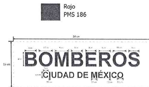
Figura 4: Especificaciones microbordado en espalda.